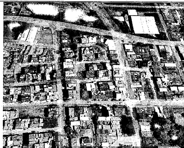
Ilustración 2. Ubicación del Arbol talado según denuncia anónima. Google Earth Pro 2026.