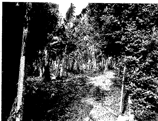
Foto 3. Cultivo de plátano, predio La Magdalena

Durante el recorrido se evidenció la presencia de residuos propios de la actividad agrícola, tales como material vegetal derivado del manejo del cultivo, pero no se observaron indicios de quemas de residuos plásticos, tales como acumulaciones de ceniza, restos de material plástico quemado o áreas con afectación visible asociada a quemas.