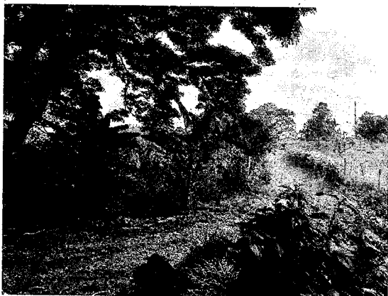
Foto 2. Cultivo de plátano, predio La Magdalena