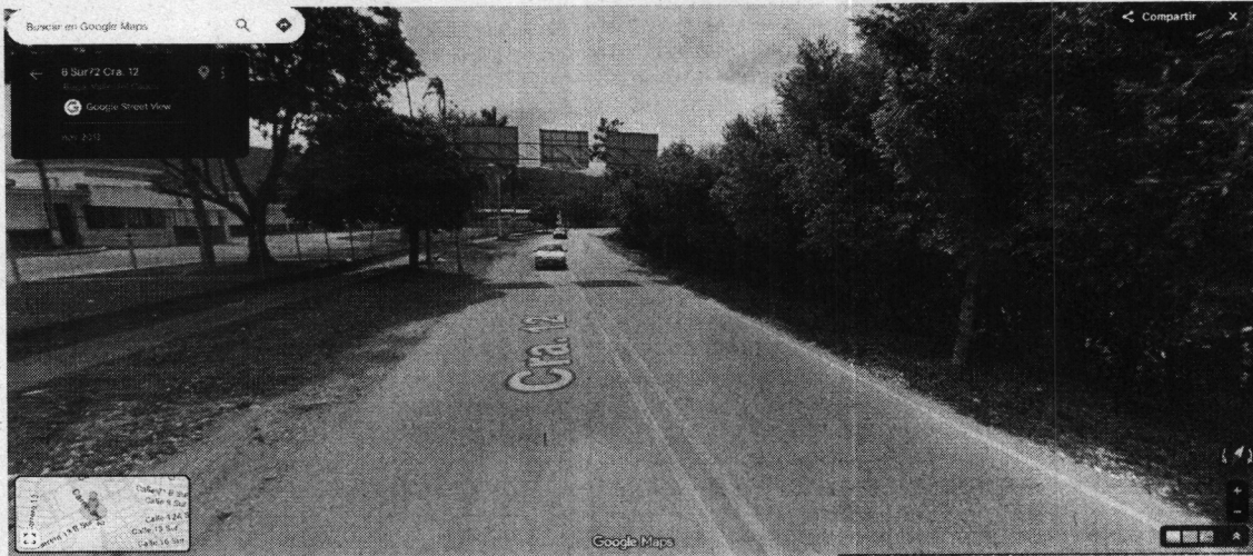
IMAGEN 3: Imagen tomada de Google maps del año 2013, donde se evidencia el espécimen Swinglea glutinosa

Así mismo, el Parágrafo 1 del Artículo 2.2.1.1.12.9. de la misma norma, establece que el aprovechamiento de las cercas vivas y barreras rompevientos, no requerirá de ningún permiso u autorización.