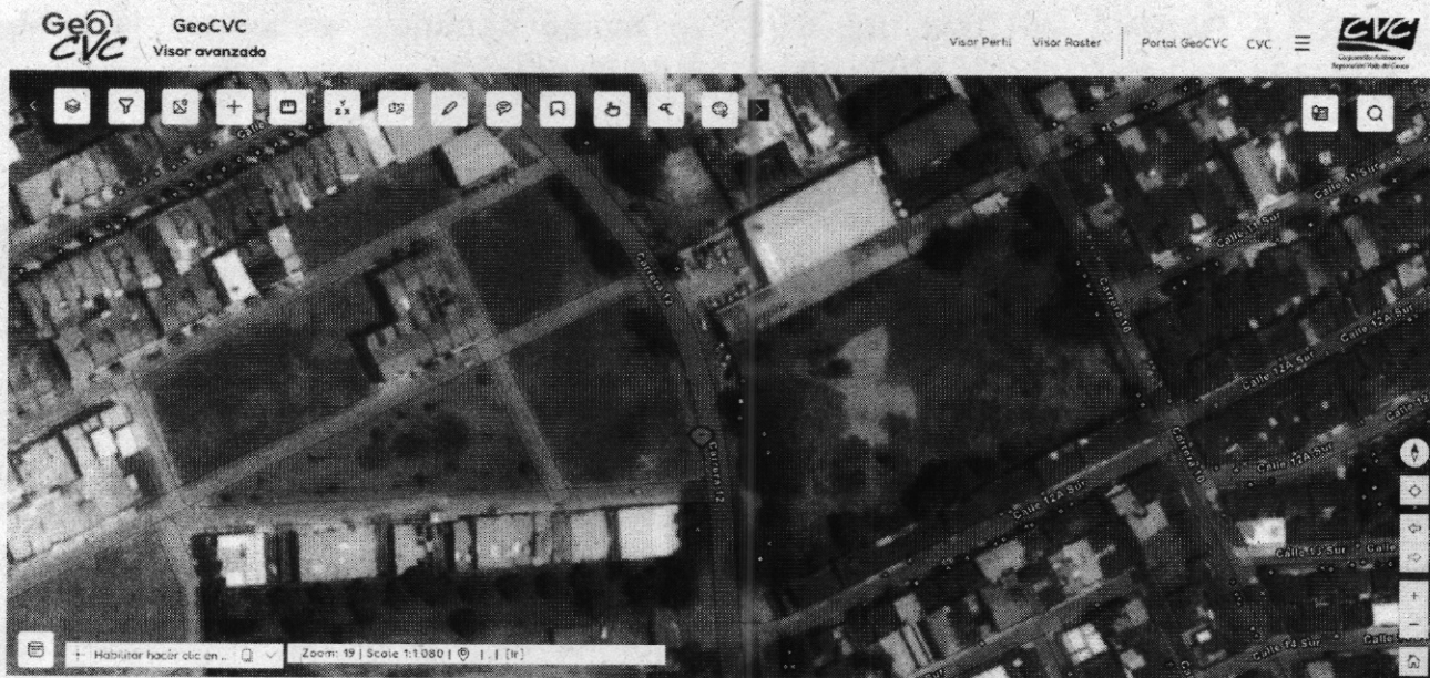
IMAGEN: que evidencia que en el predio no habían arboles de gran porte

Conviene señalar que el Artículo 1 del Decreto 1532 de 2019, las cercas vivas están conformadas por árboles o arbustos plantados en los linderos externos o internos de los predios, con el propósito de delimitar los mismos. En caso de que dichas cercas hagan parte de una plantación forestal industrial, un sistema agroforestal o silvopastoril, o cultivos forestales con fines comerciales, su aprovechamiento y registro deberán realizarse conforme a lo establecido en los artículos 2.2.1.1.12.2 y siguientes del mencionado Decreto.