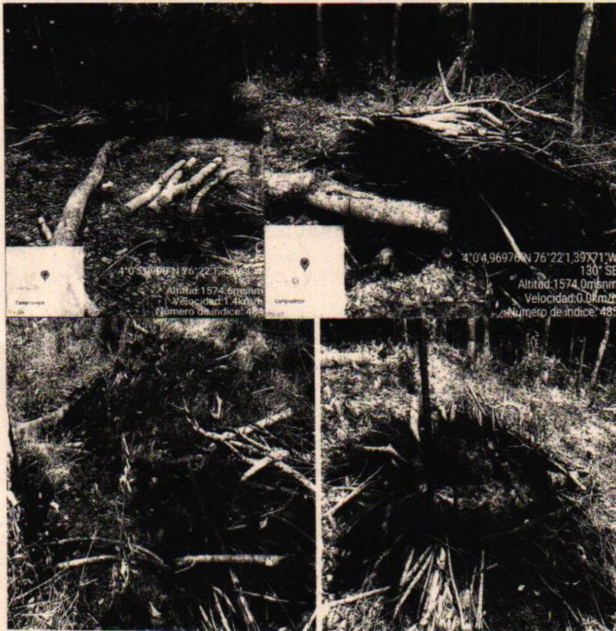
Imágenes 1 al 4: se evidencian los restos del material vegetal talado y quemado.