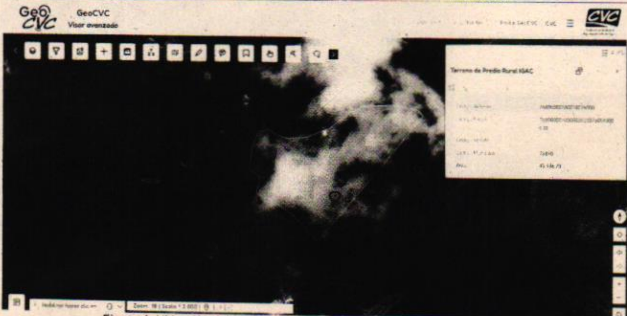
Figura 1. Ubicación del predio