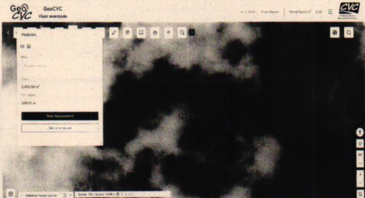
Figura 2: según las coordenadas tomadas en campo, al realizar la medición en el visor avanzado de la CVC del área intervenida y da como resultado un área de 2.403 m 2 .