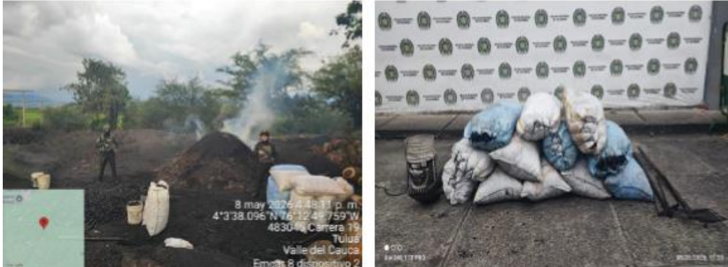
Registro fotográfico del procedimiento, adjunto en el oficio Policía NRO. GS- 2026 - / DICAR – AOPRA – 20.1.