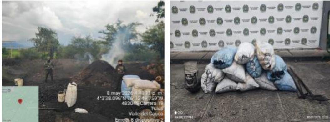
Registro fotográfico del procedimiento, adjunto en el oficio Policía NRO. GS- 2026 - / DICAR – AOPRA – 20.1.