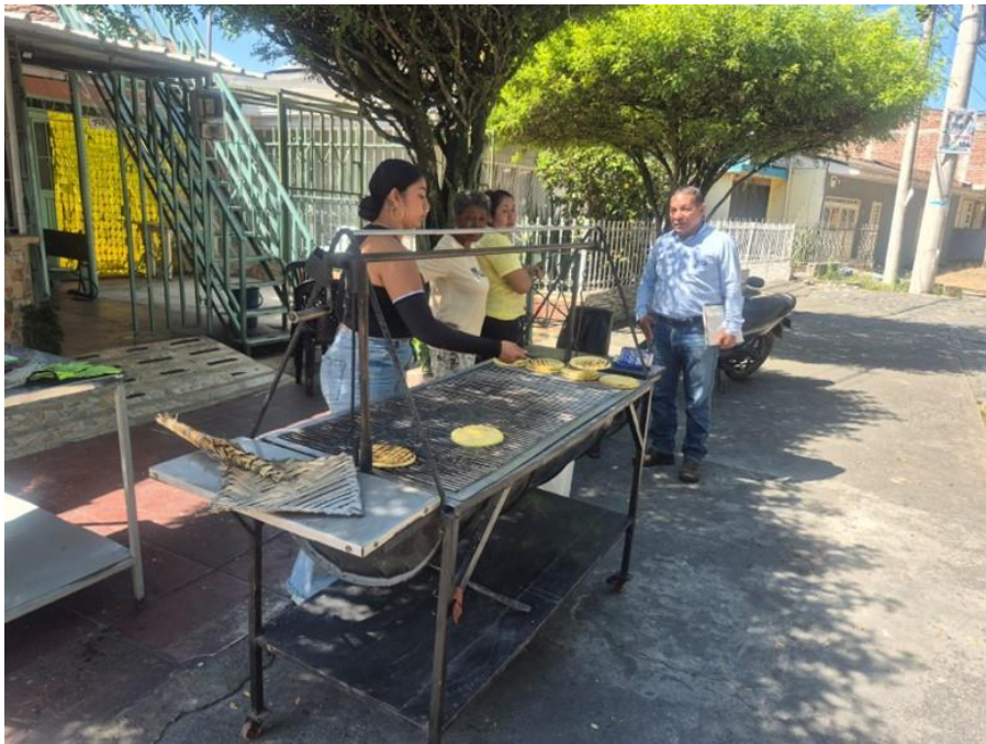
Foto 1 aspecto general del negocio de arepas