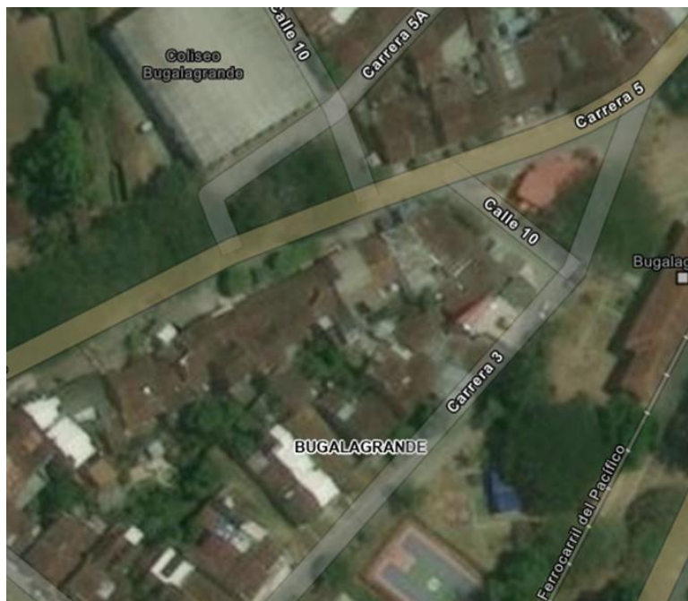
Figura 1. Ubicación del predio producto de la visita

La ubicación del expendio de productos de asado está localizada en el municipio de Bugalagrande, en la carrera 5 No 9-60, con coordenadas geográficas 4^{\circ}12'50.77''\text{N} y 76^{\circ}9'12.78''\text{W}